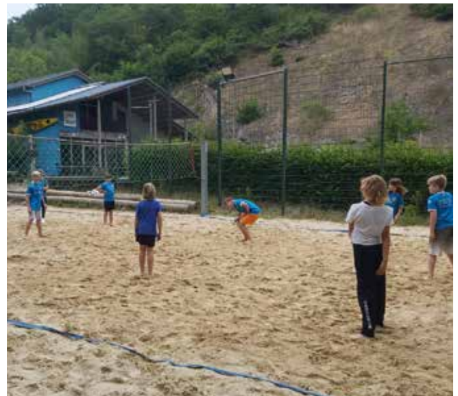
Die jüngeren versuchen sich beim Beachvolleyball.