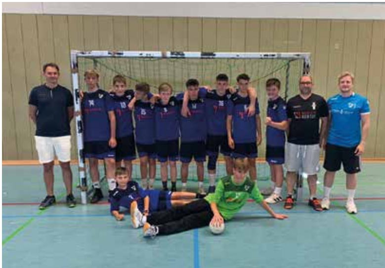
Spieler und Trainer der B-Jugend nach der erfolgreichen Qualifikation zur Bezirksberliga.

und alle waren froh darüber, einmal etwas entspannter in die kommenden Trainingseinheiten starten zu können.