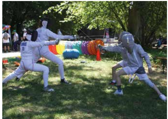
Im Wettkampf unmöglich, im Park möglich - Degen gegen Säbel