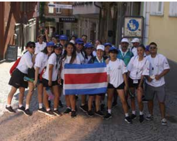
Ein kleiner Teil der Delegation aus Costa Rica beim Altstadtbummel.

Die Fechtabteilung des TV Wetzlar war stolzer Teil der Sportveranstaltung „Sport im Park“ in der Colchesteranlage, die im Rahmen des Besuchs der costa-ricanischen Delegation zu den World Games Special Olympics in Berlin stattfand.