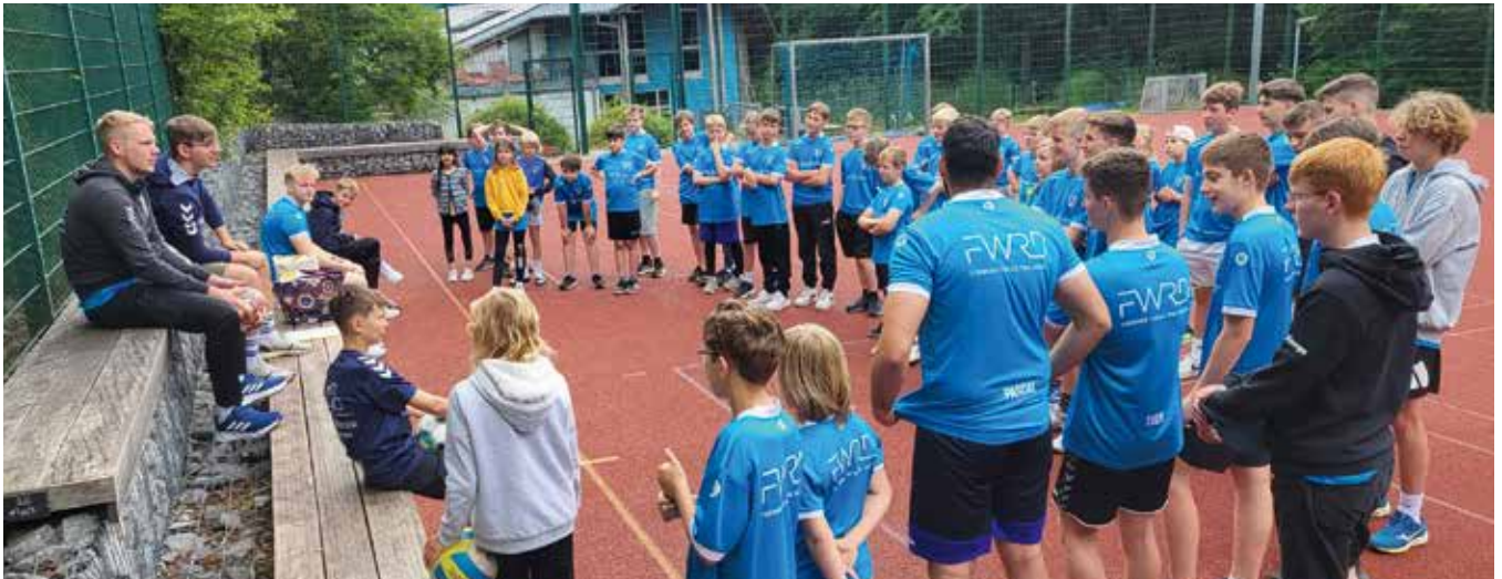
„Lagebesprechung“ oder auch: Kurze Pause für die Trainer.