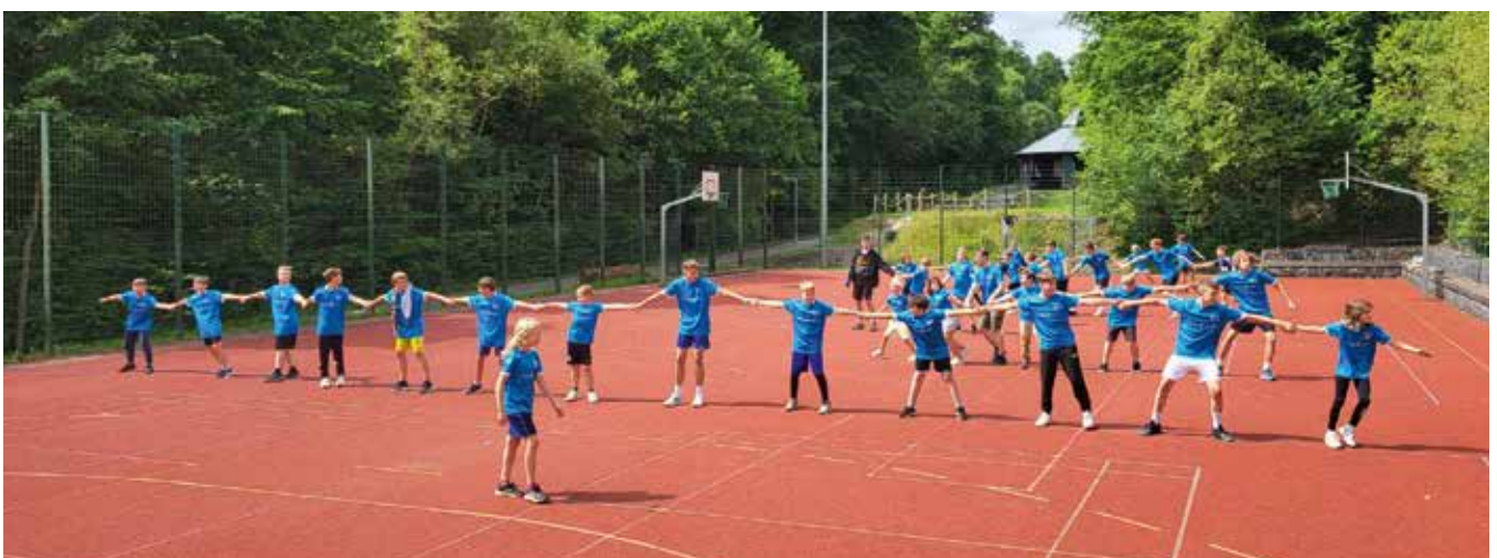
Die „Großen“ nehmen die Sache in die Hand und organisieren das Spiel. Beim Kettenfangen hatten alle ihren Spaß.