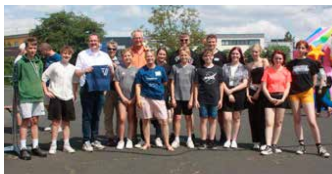
Alle haben Spaß!