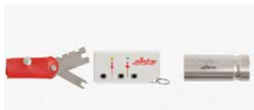
Prüflehre, Prüfkästchen, Prüfgewicht 750 gr.