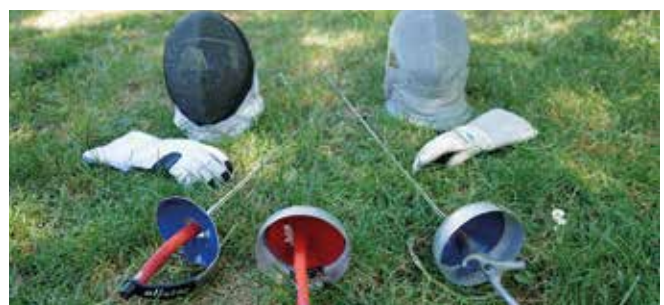
Säbel und Degenfechten im TV Wetzlar. Bitte vorbeikommen, anmelden und mitmachen!